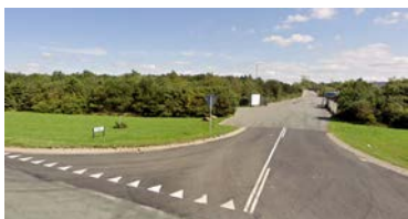
Figur 3 Tilkørsel 83 A fra Vardevej.

Renovationselskabet Esø 90 I/S har i alt 10-15 ha industri- grund i Tarm egnet til vort formål.