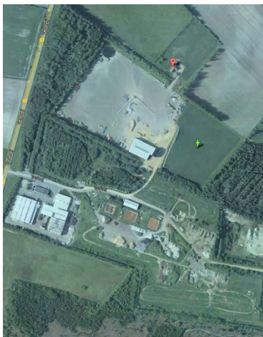
Figur 1. Vardevej 83 A, 6880 Tarm. Grøn pil markerer areal 14x.